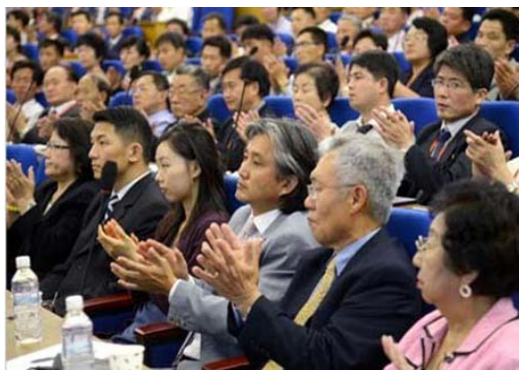
第20回国内外同胞の平壤医科学討論会