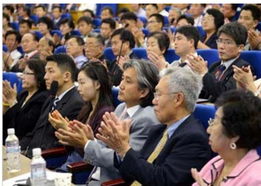
20º Seminario de ciencias médicas de compatriotas del interior y exterior del país en Pyongyang