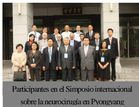
Participantes en el Simposio internacional sobre la neurocirugía en Pyongyang