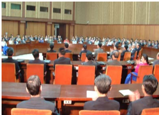
21º Seminario de ciencias médicas de compatriotas del interior y exterior del país en Pyongyang