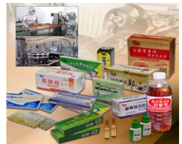
Efectivos medicamentos tradicionales y aparatos médicos producidos en las farmacias